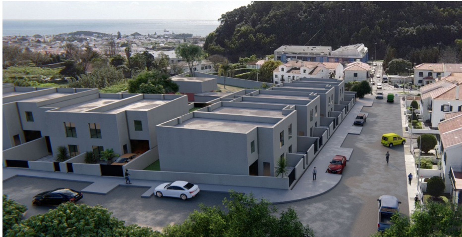
Loteamento das Quintas Fajã de Baixo, Ponta Delgada