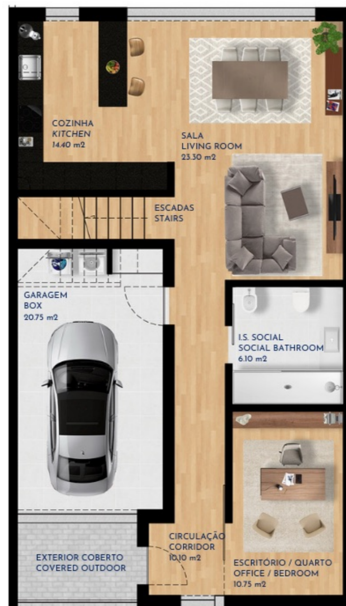
PISO 0 GROUND FLOOR 112 m 2